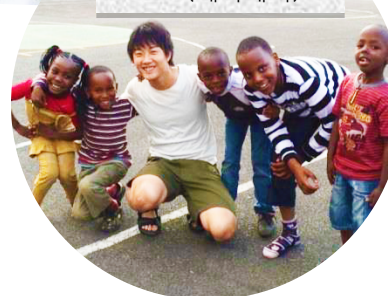
다언어 눈의 학교