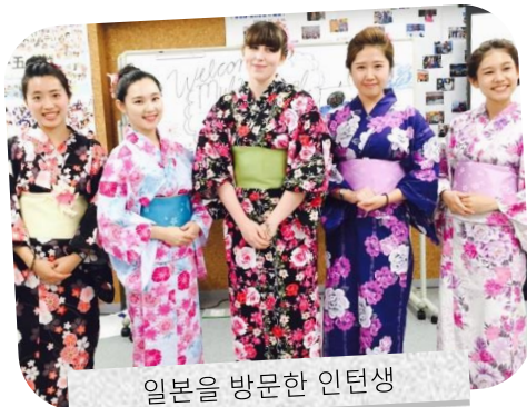
일본을 방문한 인턴생